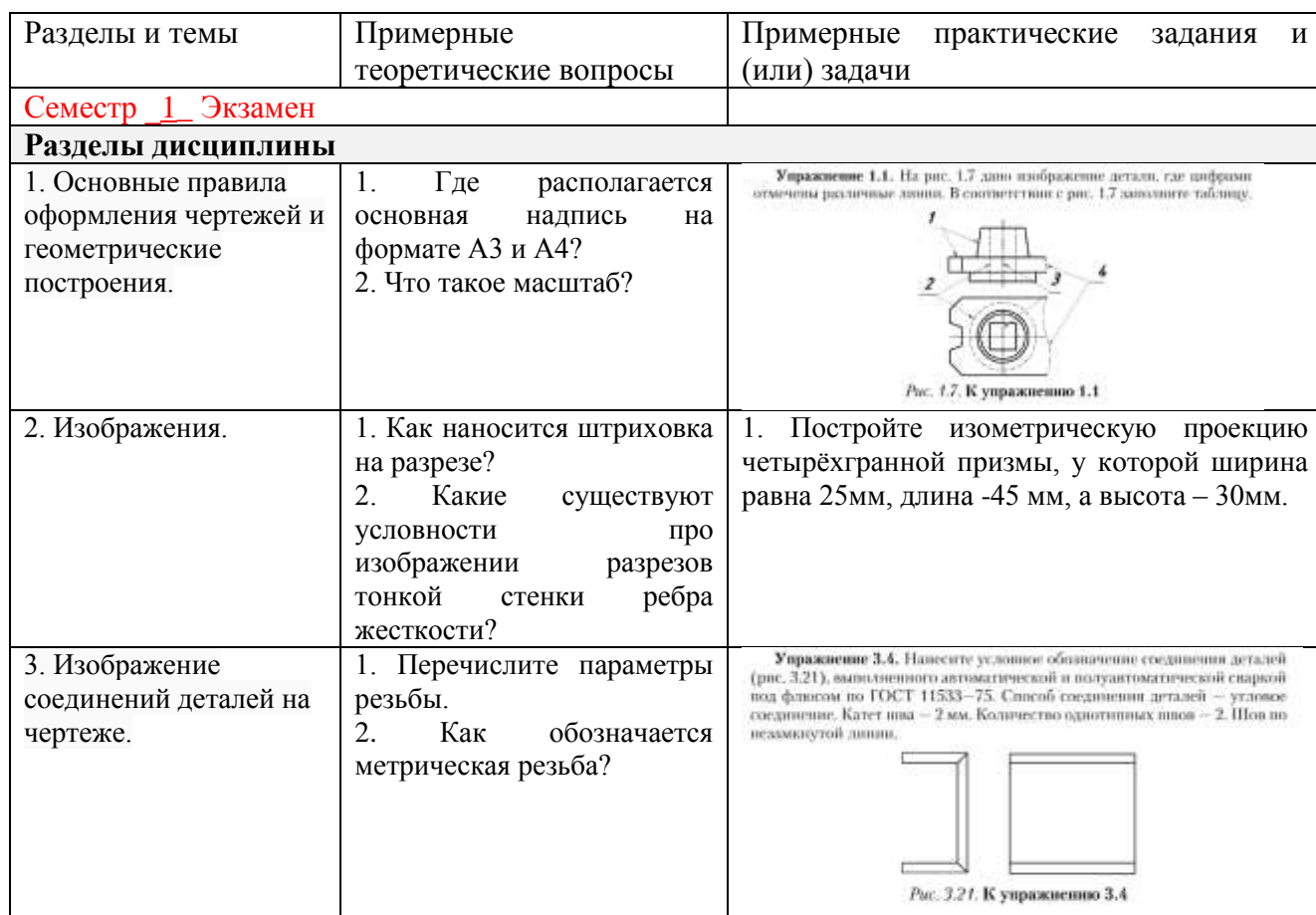
Таблица 5 – Типовые (примерные) контрольные вопросы и задания