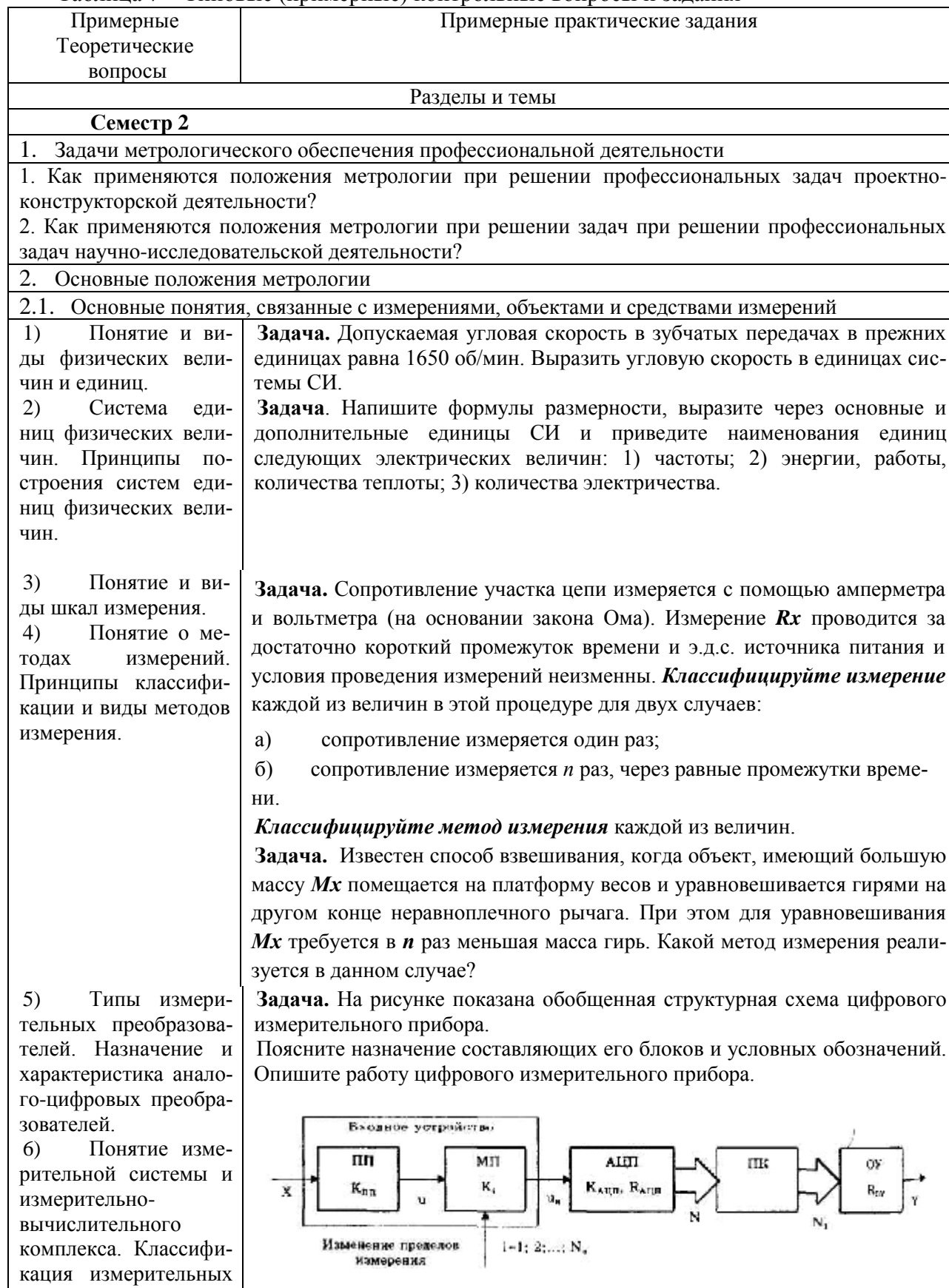
Таблица 7 – Типовые (примерные) контрольные вопросы и задания