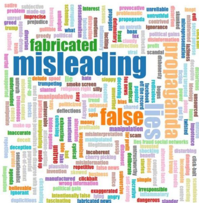
Визуализация задания 1 недели курса

III. Задание сформулировано справа от облака (картинки):