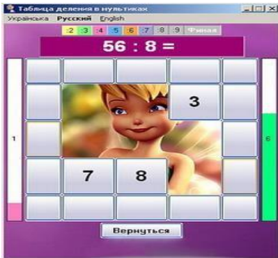
Таблица деления в мультиках

Обучающая программа по математике, позволяющая изучать таблицу деления двузначных чисел на числа от 2 до 9 поэтапно с использованием картинок и мелодий из отечественных и зарубежных мультфильмов. Рассчитана на учащихся 2-4-х и старше классов.