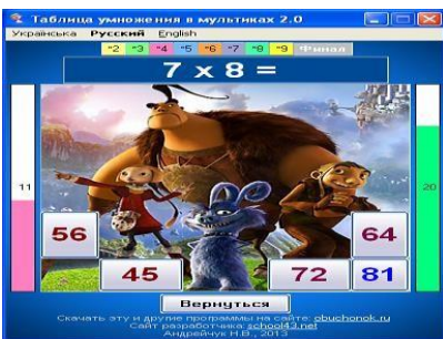
Таблица умножения в мультиках

Обучающая программа по математике, позволяющая изучать таблицу деления двузначных чисел на числа от 2 до 9 поэтапно с использованием картинок и мелодий из отечественных и зарубежных мультфильмов. Рассчитана на учащихся 2-4-х и старше классов.